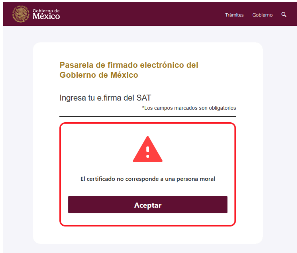
Imagen 5. Mensaje de error al intentar usar una e.firma de persona física.

Ver Imagen 5. mensaje de error al intentar usar una e.firma de persona física